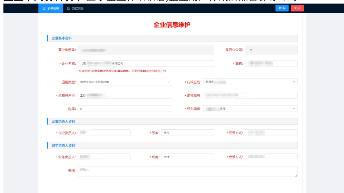
图 2-6 企业个人资料表单