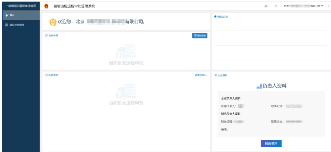
图 2-1 退税外网企业首页

当前申报模块： 显示当前申报信息，点击申报信息可查看当前申报单具体内容，点击退税登记，打开新的退税申报单。