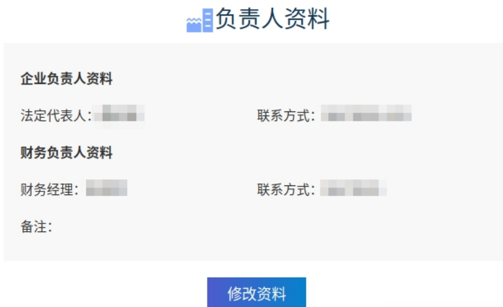
图 2-5 修改资料模块