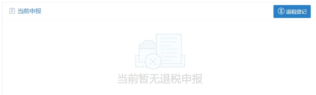
图 2-2 当前申报模块

当前申报模块： 显示当前申报信息，点击申报信息可查看当前申报单具体内容，点击退税登记，打开新的退税申报单。